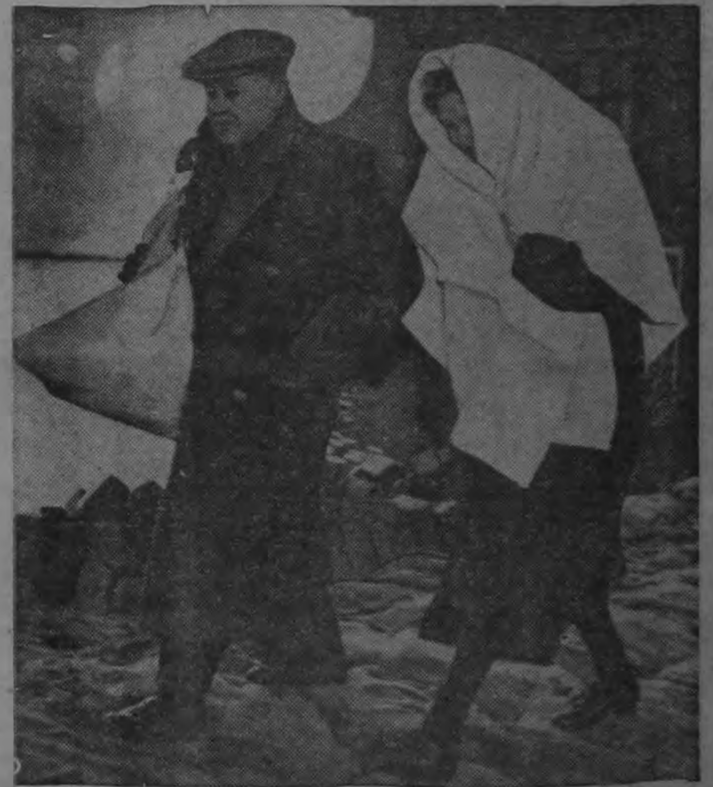
Llevando lo poco que pudieron salvar de las inundaciones que arrasaron su casa en Gravendeel, Holanda, una pareja avanza por el único camino de escape aún abierto, en busca de abrigo en otra parte. En Holanda las muertes a causa de la inundación suman 873 estando bajo el agua más de la quinta parte de la nación.

La declaración de Dulles fue formulada en sesión secreta celebrada por la comisión de asuntos extranjeros de la cámara.