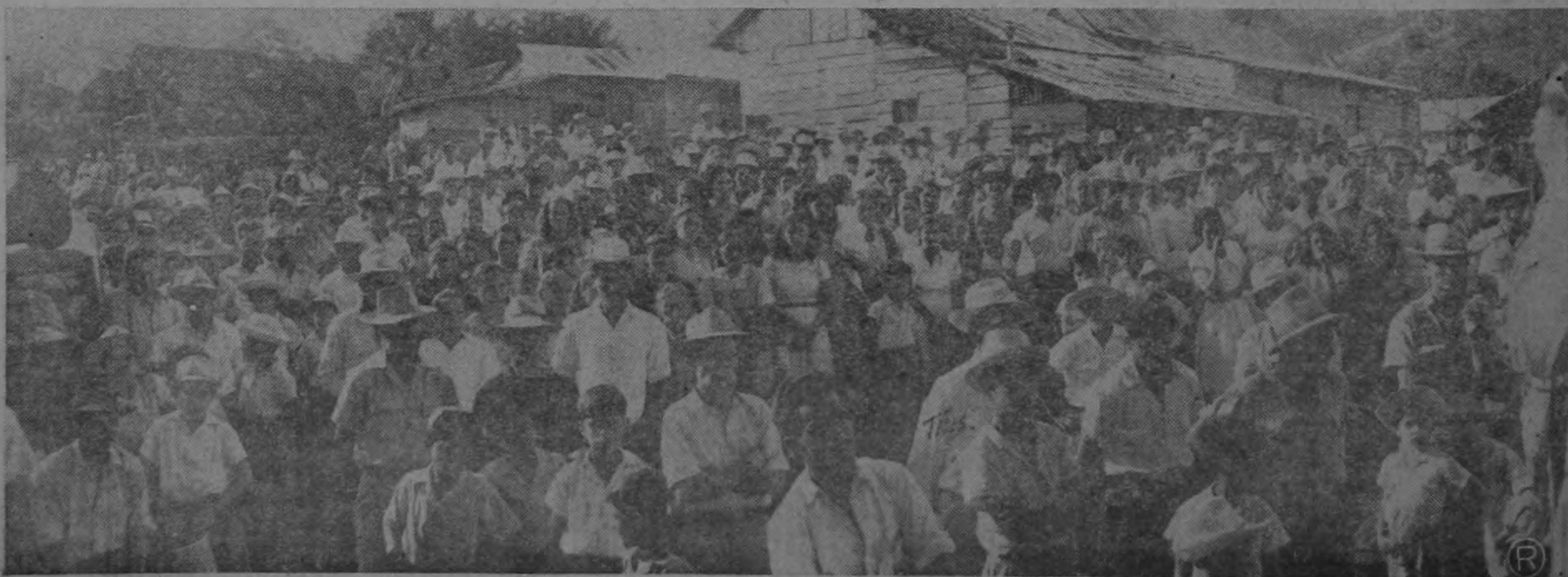
VISTA PARCIAL DE LA REUNION DE PIEADAES SUR DE SAN RAMON