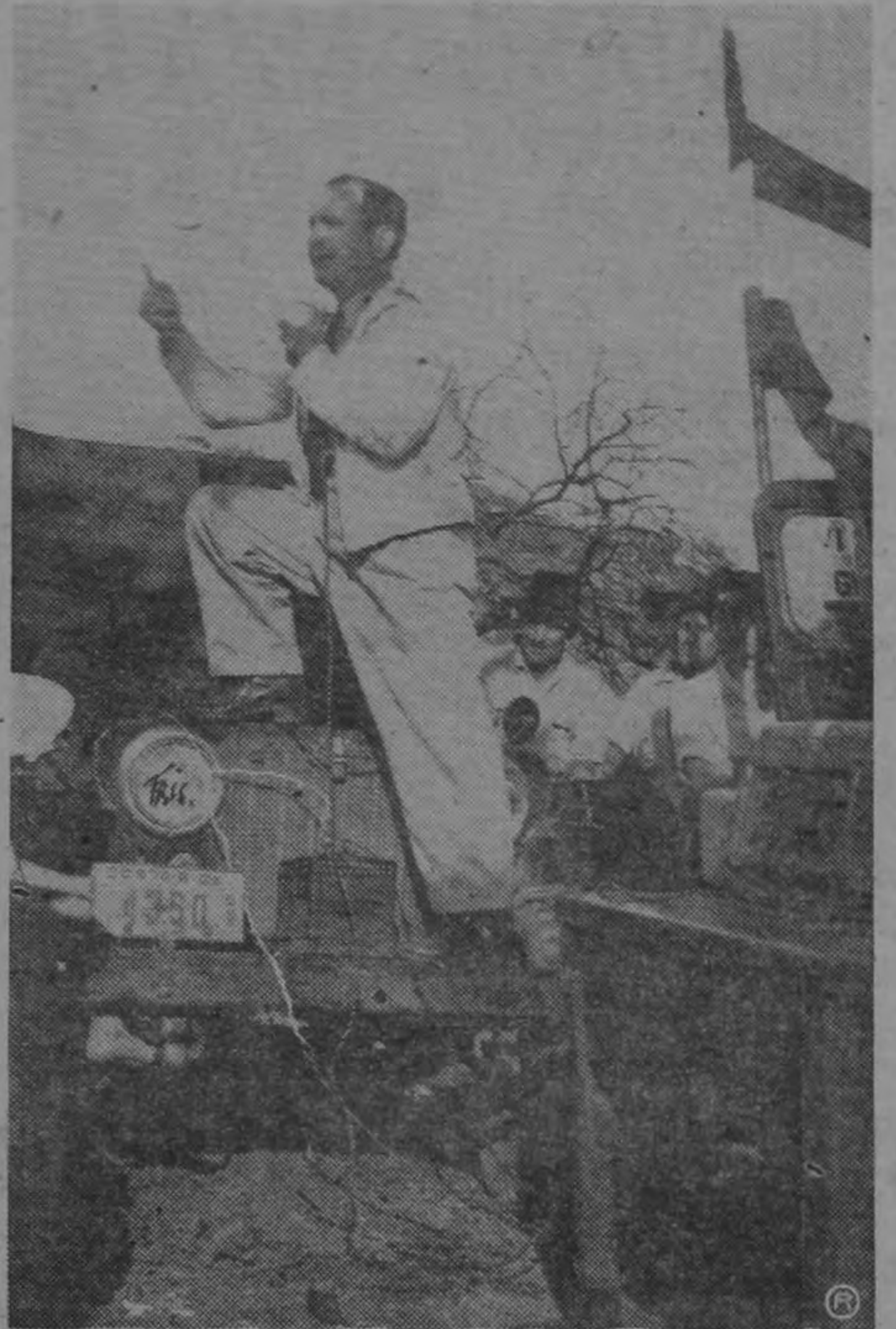
Para nuestro insigne Jefe cualquier tribuna es cómoda para improvisar sus conferencias...

Cuando don José asuma el Poder, llegará bien informado acerca de las necesidades de todos los pueblos de la nación. De esta manera podrá enfocar los problemas nacionales en una forma integral. Irá atando cabos para confeccionar planes generales de acción. Además de beneficioso, ello será de gran economía, pues el gobierno tendrá base suficiente para trazar los métodos generales de trabajo, para llevar al país el progreso en una forma coordinada y segura.