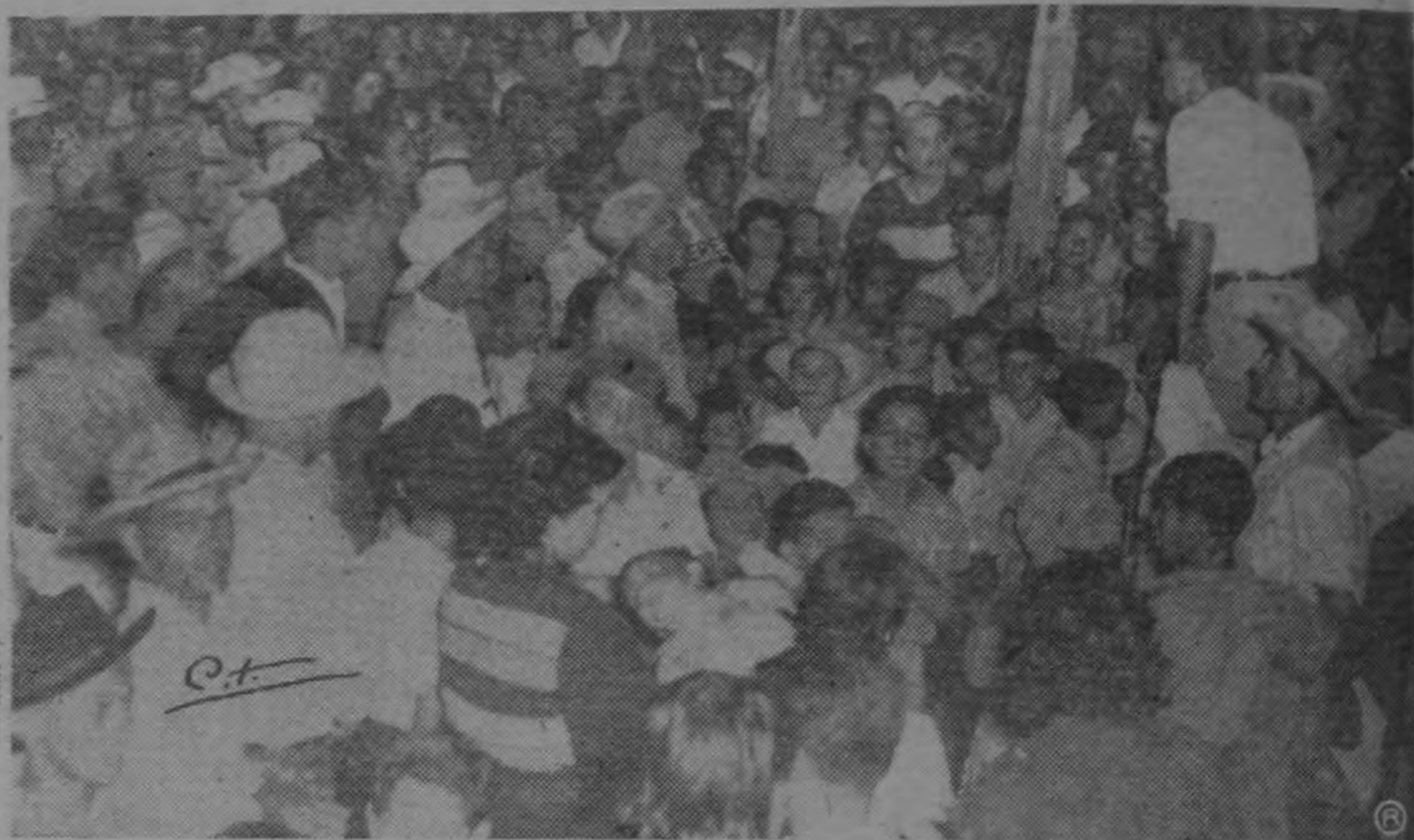
Aspecto parcial de la reunión de Piedades de Santa Ana