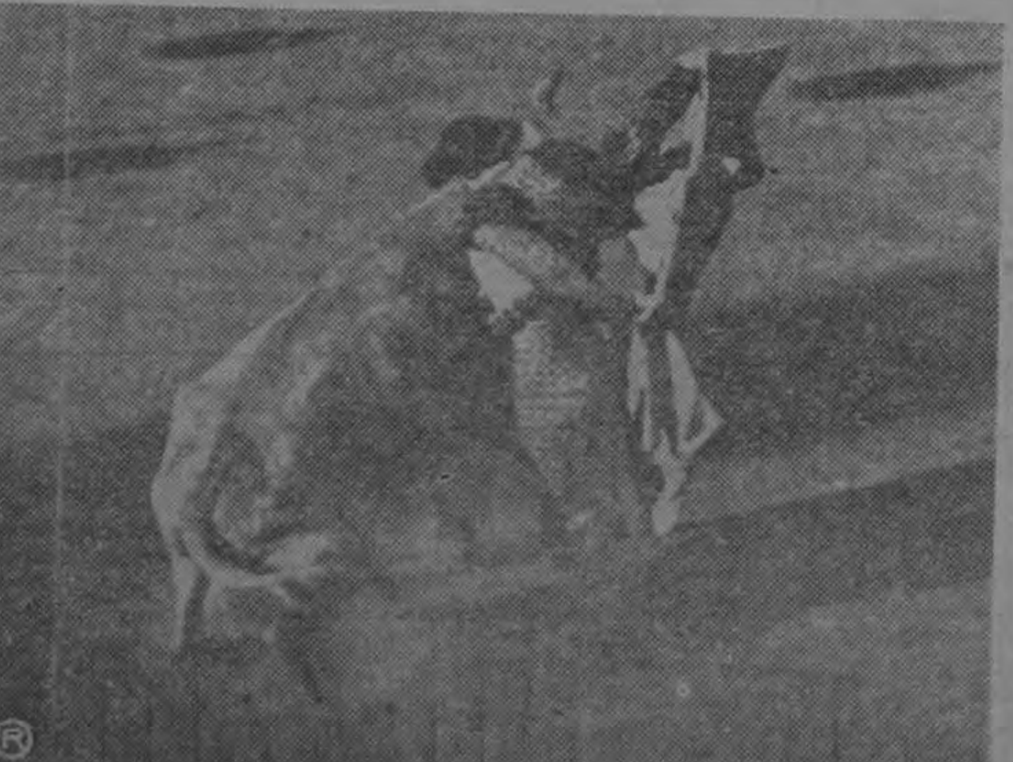
Una lucida suerte con el capote durante la corrida del domingo en la Plaza Solera, que estuvo más interesante y animada que la anterior.—(Foto Arévalo).

La carestía de la vida que aumenta día con día y la popularidad de Guevara Moreno, —a quien desterró—, son poderosos factores en su contra.