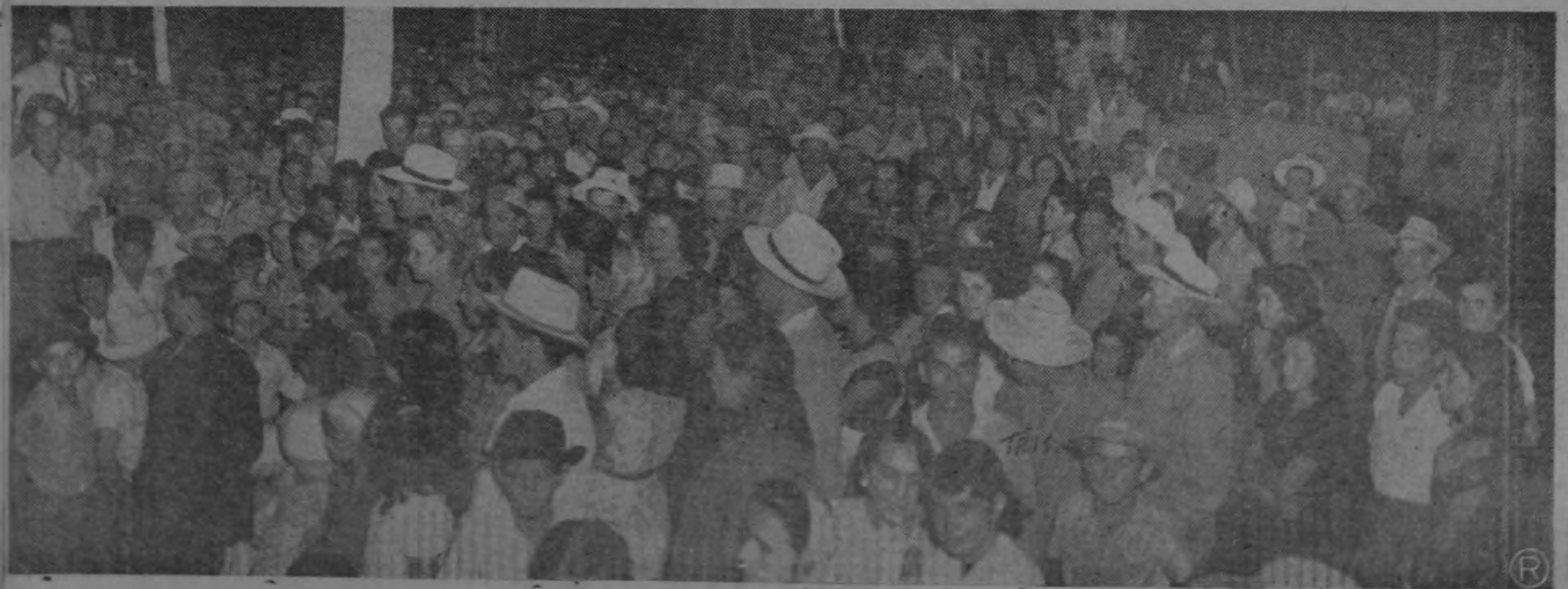
VISTA PARCIAL DE LA REUNION DE SANTIAGO DE SAN RAMON